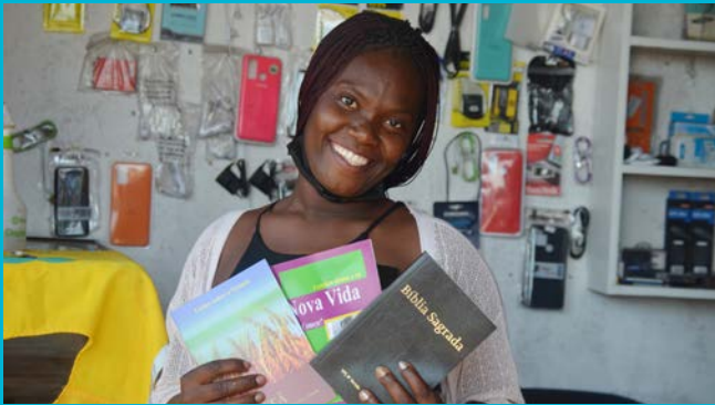
Freude über die eigene Bibel