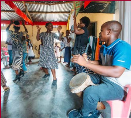
Freudiger Gesang in Bentos Gemeinde