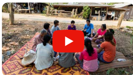
Religion, Reis und Ruinen in Thailand