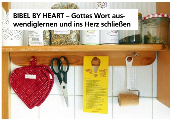
BIBEL BY HEART – Gottes Wort auswendiglernen und ins Herz schließen