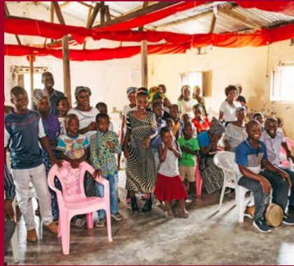
Gottesdienst als Familienereignis