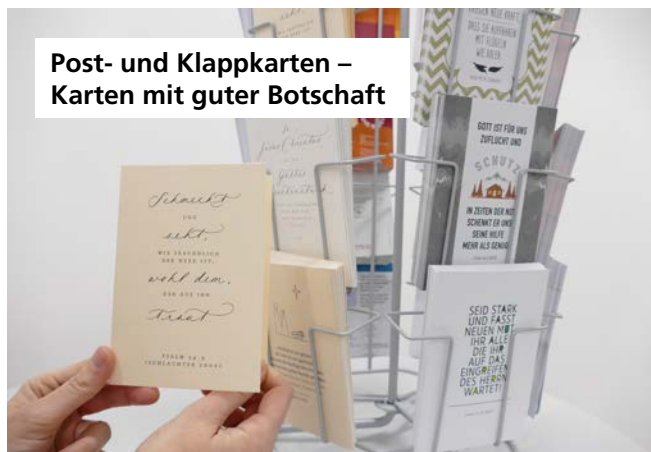
Post- und Klappkarten – Karten mit guter Botschaft