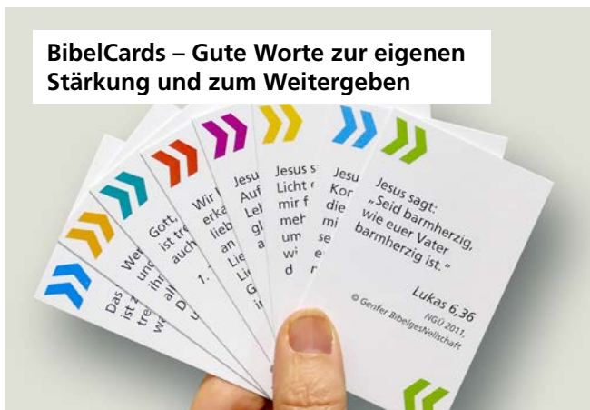
BibelCards – Gute Worte zur eigenen Stärkung und zum Weitergeben