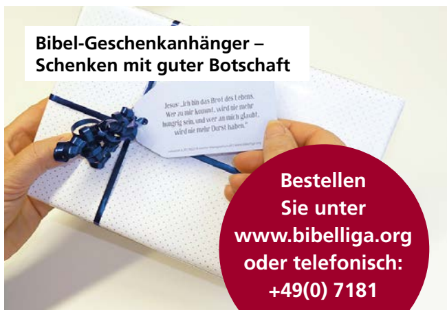
Bibel-Geschenkhänger – Schenken mit guter Botschaft

Bestellen Sie unter www.bibelliga.org oder telefonisch: +49(0) 7181 937 8832