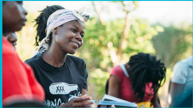
Junge Mosambikanerinnen beim Bibelstudium

Gottes wissen, sind sie empfänglich. Sie hören zu, beginnen zu verstehen und entwickeln einen Hunger nach mehr. Auf diese Weise haben wir bereits mehrere Bibelgruppen und eine neue Gemeinde gegründet.