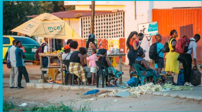
Tagelöhner warten in Maputo auf ein Jobangebot