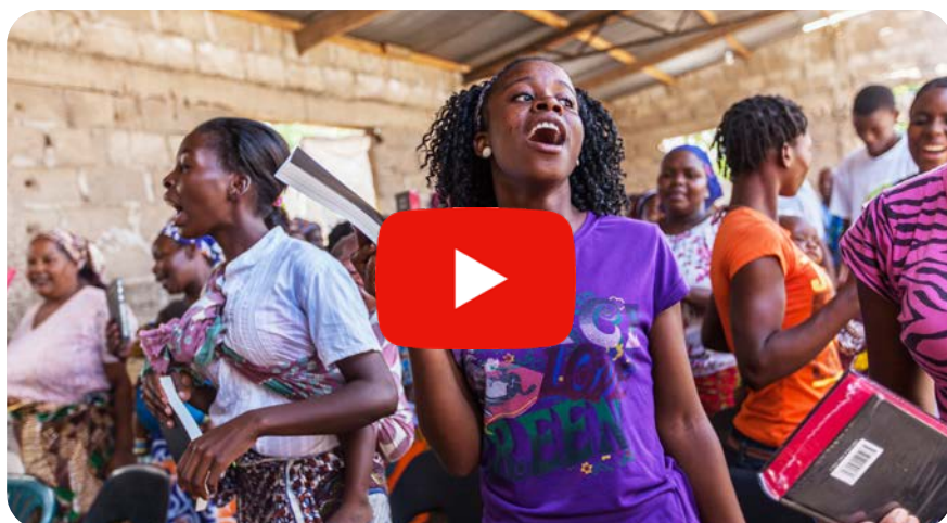
Strände, Armut und Glauben in Ostafrika – Christen in Mosambik

Viele bewegende Clips aus den Missionsländern mit interessanten Berichten und Informationen. Wir laden Sie zu einer Entdeckungsreise in unseren Youtube-Kanal ein. Auch zu Mosambik, unserem Magazin-Fokusland, werden Sie fündig.