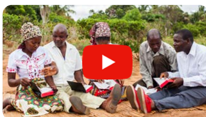
Die Bibel Liga – kurz und knapp