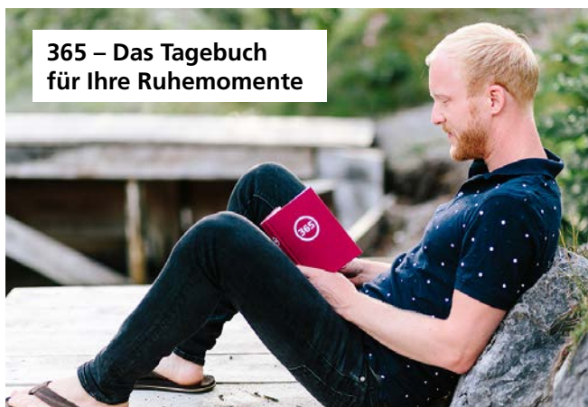
365 – Das Tagebuch für Ihre Ruhemomente

Die Bibel-Appetizer helfen beim Innehalten und Ausrichten auf Gott im Alltag. Sie enthalten Bibelworte zur Ermutigung, zum Nachdenken und Einprägen. Nutzen Sie die kostenlosen Produkte für sich selbst, geben Sie sie weiter und kommen Sie über Gottes Wort ins Gespräch.