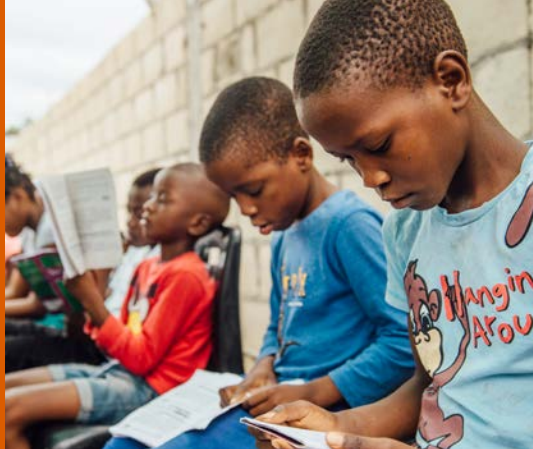
Philippus-Jugendgruppe in Mosambik

Alles Wichtige über Gott und Jesus wissen wir Menschen nur aus der Bibel. Sie öffnet den Weg zum rettenden Glauben. Durch Texte der Bibel können Menschen Jesus aus erster Hand kennen lernen und ihren Glauben verlässlich in Gottes Wort gründen. Darum helfen wir einheimischen Gemeinden und Missionspartnern mit Bibeln, Bibelkursen und missionarischen Schulungen.