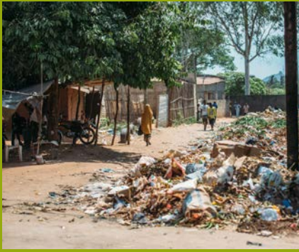
Schutt vom Sturm – überall sichtbar