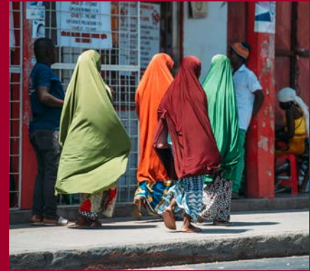
Verhüllte Muslimas in Nampula