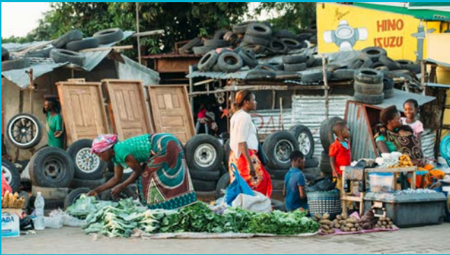
An der Straße wird alles Mögliche verkauft ...