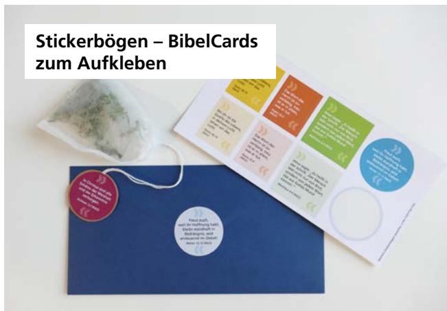
Stickerbögen – BibelCards zum Aufkleben