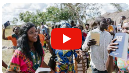
Die Bibel Liga in Sambia