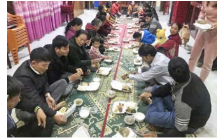
Bibel-Schulung in Nordvietnam

■ Die Mitarbeiter der Bibel Liga in Vietnam berichten dankbar von neuen und bewährten Partnerschaften mit Gemeinden aus unterschiedlichen protestantischen Denominationen. Das lokale Team erlebte gerade im Pandemie-Jahr 2021, dass die Einheit unter Vietnams Christen enger wurde und konfessionelle Unterschiede nicht nur trennen, sondern auch gegenseitig bereichern können. Derzeit sind von 96,5 Mio. Einwohnern etwa 6 Mio. katholisch (7%) und knapp 1 Mio. protestantisch (Tendenz steigend). Die überwiegende Mehrheit der Bevölkerung (86%) gilt als atheistisch, wobei viele Vietnamesen traditionelle Glaubensvorstellungen haben – wie den Glauben an eine Gottheit („Yang“), die das Universum erschaffen hat – oder einen Geisterglauben, in dem verstorbene Angehörige eine Rolle spielen. In den letzten beiden Jahren haben vermehrt Gemeinden mit Mitgliedern indigener Völker im bergigen Norden Vietnams (Hmong, Kadong u.a.) Bibelstudiengruppen in ihrer Region angeboten. Insgesamt absolvierten 2021 über 10.000 suchende Menschen in Vietnam einen Bibelkurs in einer Partnergemeinde.