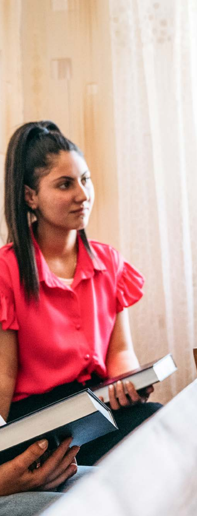
Die junge Generation ist hungrig nach Gottes Wort.