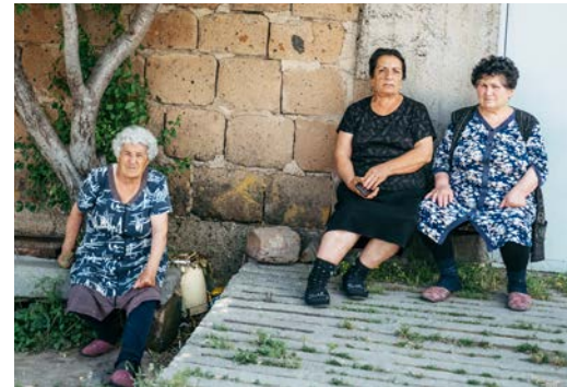
Mehr als 100.000 Flüchtlinge aus Arzach leben in Armenien.