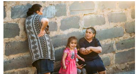
Über 100.000 Menschen flohen aus Arzach.