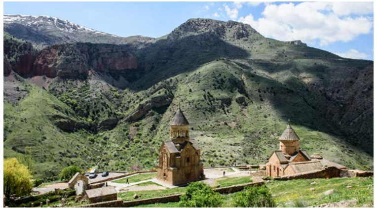
Die historischen Klöster und Kirchen täuschen darüber hinweg, dass nur wenige Armenier Jesus kennen.