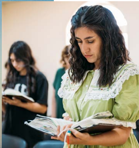
Junge Menschen finden festen Halt in Gottes Zusagen.