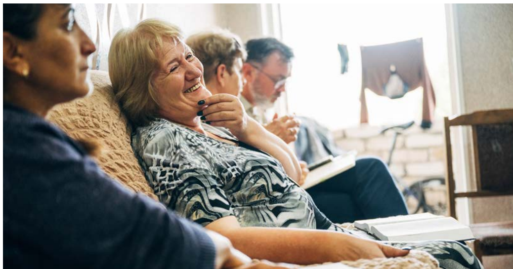
Aus einigen Bibelgruppen entstanden kleine Gemeinden.