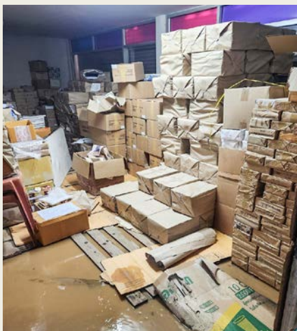
Viele Bibeln wurden bei der Flut zerstört.